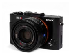
Sony RX1R II