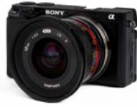
Oblicua Sony a6100 Cámara de mapeado 3D